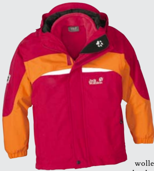
LITTLE GIANT Jack Wolfskin

Es gibt sie, die echte Funktionsbekleidung für Kinder und dank dichtem Händlernetz und Jack-Wolfskin Stores ist sie auch tatsächlich am österreichischen Markt erhältlich. Wir haben uns die Little Giant angesehen. Sie ist wie eine „Große“ als Doppeljacke aufgebaut, besitzt eine Texapore Membrane, ist dank dieser absolut wasserdicht und bietet ein angenehmes Klima beim Tragen. Doch was diese Jacke besonders auszeichnet ist die Eigenschaft, dass man sie nicht nur im Winter verwendet, sondern auch ohne dem warmen Innenteil bis in den Sommer nützen kann und somit ist sie auch für preisbewusste Eltern ein absoluter Kauf Tipp! Erhältlich in den Größen 104 bis 176 und in verschiedenen Farben und natürlich ausgerüstet mit Reflektoren zur Erhöhung der Sicherheit.