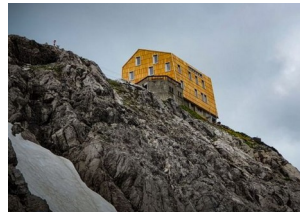
Totalphütte 2385 m