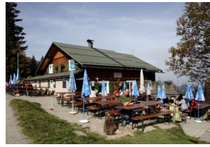
Lustenauer Hütte 1250 m