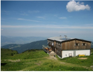
Freschenhaus 1846 m