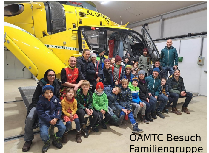
ÖAMTC Besuch Familiengruppe Mittwochswanderer bei der Lasanggabücke