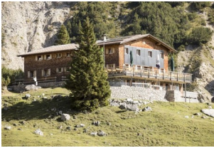
Heinrich-Hueter Hütte 1766 m