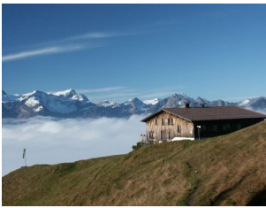
Frassenhütte 1725 m