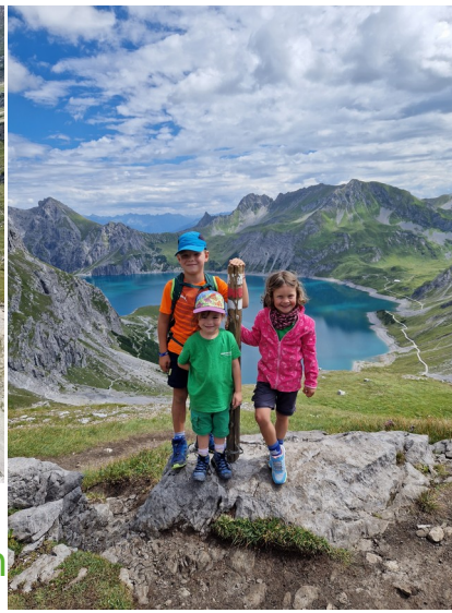
Spiel, Spaß und Spannung bei der Familiengruppe