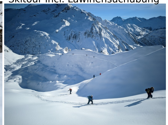
Skitour incl. Lawinensuchübung