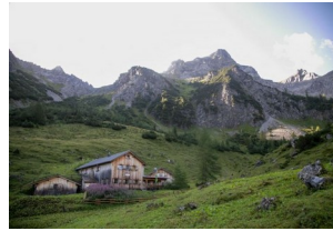
Sarotlahütte 1611 m