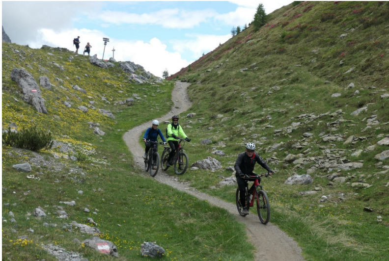
Bikewochenende Idro und Livigno