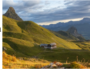
Tilisunahütte 2211 m