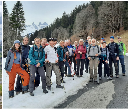
Ausflug der Tourenleiter:innen