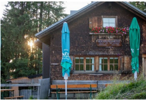
Hochälpelehütte 1460 m